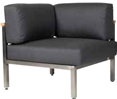
Gomera Sun & Rain Eckelement

Hochwertiger Edelstahl/304-Rahmen mit einer Bespannung aus Sunproof Sling® in Schwarz/Silber. Umlaufende Armlehnen aus recyceltem, altem Teakholz sowie stufenlos verstellbarem Kopfteil bei den langen Eckelementen mit Armlehne. Inklusive Sitz- und Rückenkissen mit wasserfestem Markenstoff von Tuvatextil® (100 % spinnfärbte Acrylfasern mit einer wasserundurchlässigen Beschichtung) für ein komfortables Sitz- und Liegegefühl.