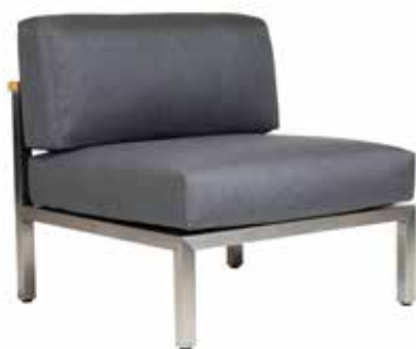
Gomera Sun & Rain Mittелеlement