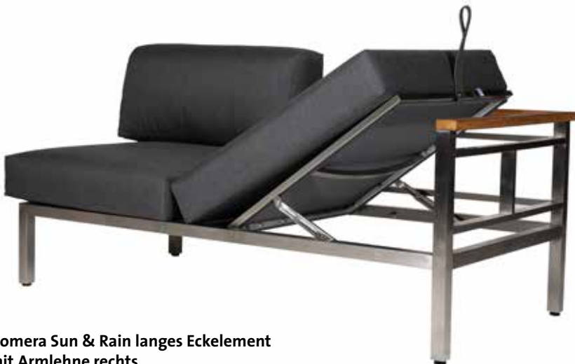
Gomera Sun & Rain langes Eckelement mit Armlehne rechts (rechte Sitzfläche höhenverstellbar)