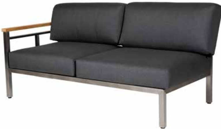
Gomera Sun & Rain langes Eckelement mit Armlehne links (linke Sitzfläche höhenverstellbar)